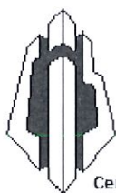
M. Powis Syndic ECO FAC

SPRL ECO FAC BVBA 70, rue St. Henri - 1200 Bruxelles ☎ 0475 74.24.67 - fax: 02 733.21.45 CCB 068 2259130 27. RCB 59 6 528 BCE: 0 456 394 007 Expert CEJA: 816